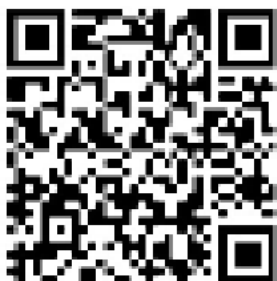
PROFESSOR DE EDUCAÇÃO ESPECIAL Direção Geral de Educação

Toda a informação resultante da intervenção técnica e educativa, designadamente o Relatório Técnico-Pedagógico, deve constar do processo individual do aluno e está sujeita aos limites constitucionais e legais, designadamente ao disposto na legislação sobre proteção de dados pessoais, no que diz respeito à confidencialidade e ao acesso e tratamento desses dados e sigilo profissional Artigo 26.º, do Decreto-Lei n.º 54/2018, de 6 de julho.