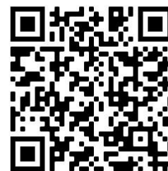
PLANO INDIVIDUAL DE TRANSIÇÃO