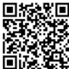
PROGRAMA EDUCATIVO INDIVIDUAL